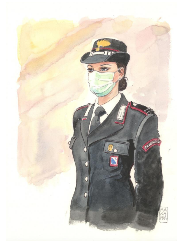
הומאז לנשים העומדות בחזית המאבק בקורונה- מאת מילו מנרה